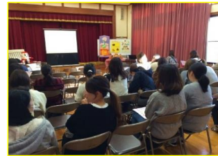
保育園保護者会にて